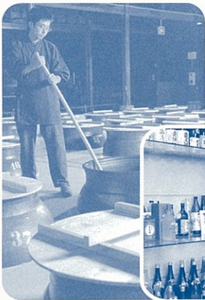
鹿児島自慢の 焼酎がズラリ!