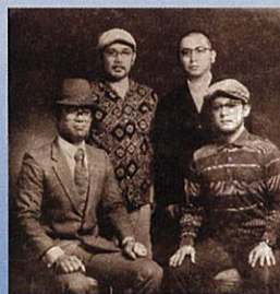
サーモン&ガーリック(奄美在住)